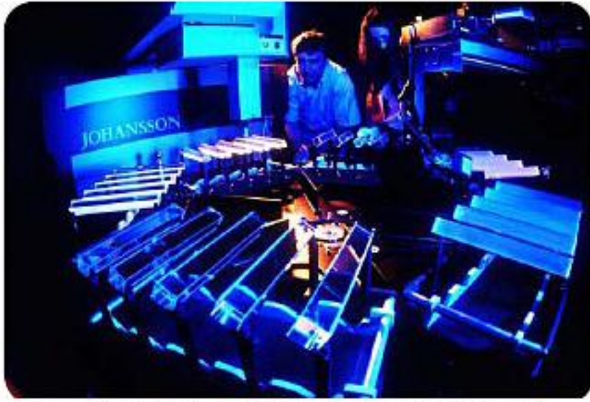
ADC AD9042 de ADI medir la energía absorbida por estos cristales de tungstato de plomo